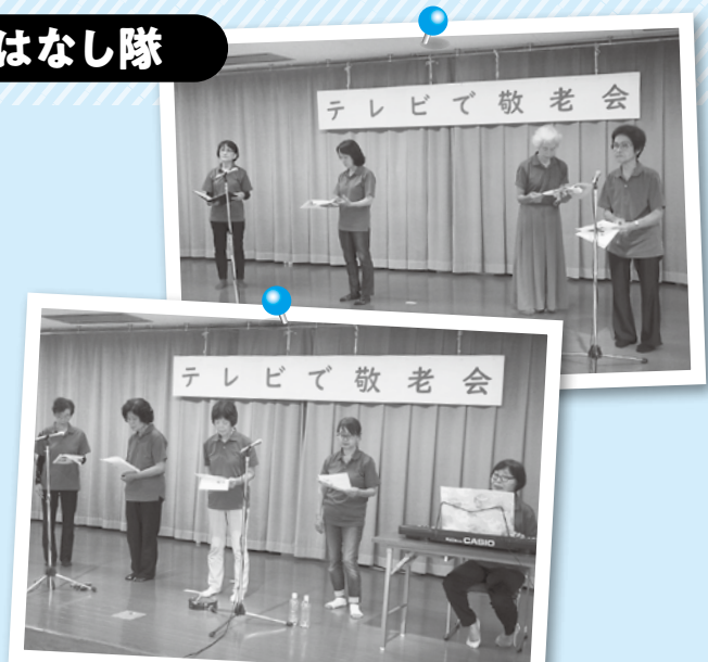
川辺町女性の会ブレーメンのお話し隊のみなさん

川辺町女性の会ブレーメンのおはなし隊は読み聞かせのグループです。敬老会では、川辺の昔話を劇にするなど毎年工夫を凝らしたおはなしを披露していただきます。川辺の昔話「馬串の孫太郎と尾崎の尾白」とブレーメンのおはなし隊の名前の由来になった「ブレーメンの音楽隊」を披露していただきました。昔話を聞いて優しい気持ちになってほしい、ブレーメンの音楽隊のように、年をとっても楽しく過ごしてほしいという願いを込めておはなしをしていただきました。