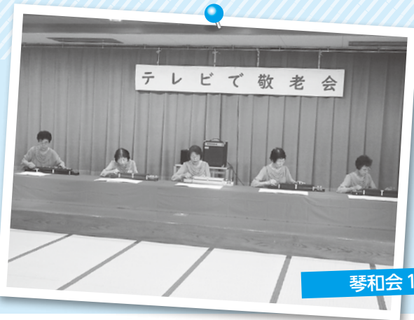
琴和会1のみなさん