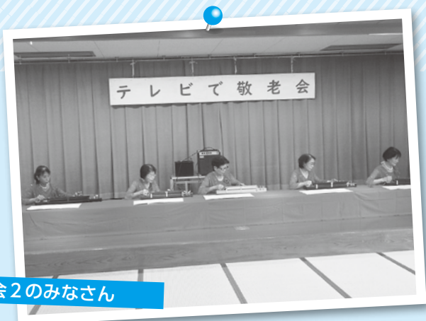
琴和会2のみなさん

「コロナが終息し、皆さんの前で演奏できる日を楽しみにしています。」と前向きなお言葉をいただきました。