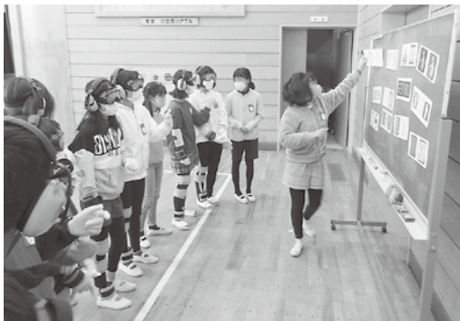
【西小】 高齢者疑似体験の様子

令和3年11月15日に川辺西小学校で車いす体験と高齢者疑似体験を、11月29日にパラスポーツ体験を実施しました。パラスポーツでは「ボッチャ」と「ゴールボール」を実際に体験し、その楽しさを感じていただきました。