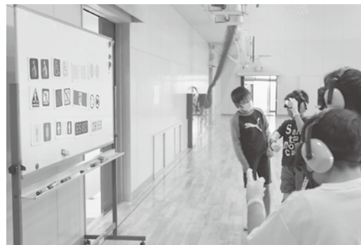
【北小】 高齢者疑似体験の様子

この授業を通じて、高齢者や障がい者がどんな気持ちなのか、どのように接したら良いのかなどを学んでいただけたと思います。町内に福祉の心を持った児童が一人でも増え、将来の川辺町を担う人になってくれることを願っています。