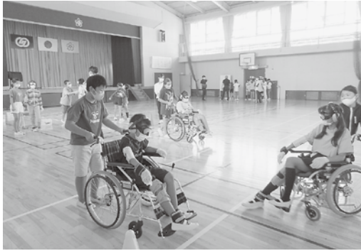
【東小】 車いす体験の様子

令和3年10月5日に川辺東小学校で車いす体験と高齢者疑似体験とヘルパーの講話を実施しました。ヘルパーの講話では、講師の話に真剣に耳を傾ける姿が見られました。