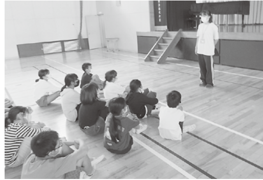
【東小】 ヘルパー講話の様子

令和3年11月15日に川辺西小学校で車いす体験と高齢者疑似体験を、11月29日にパラスポーツ体験を実施しました。パラスポーツでは「ボッチャ」と「ゴールボール」を実際に体験し、その楽しさを感じていただきました。