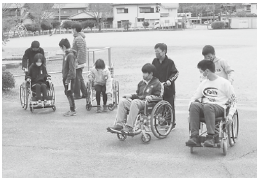
【北小】 車いす体験の様子

11月30日に川辺北小学校で車いす体験と高齢者疑似体験を実施しました。実際に体験することで、高齢者や車いすに乗っている方の気持ちを感じていただきました。