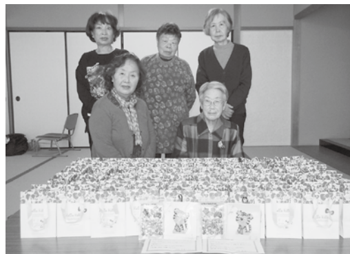
押し絵ボランティアの皆様

中学生以下の母子父子及び両親のいない家庭にスイーツと押し絵ボランティア作成のプレゼント（干支の押し絵、シトラスリボン）を届ける。