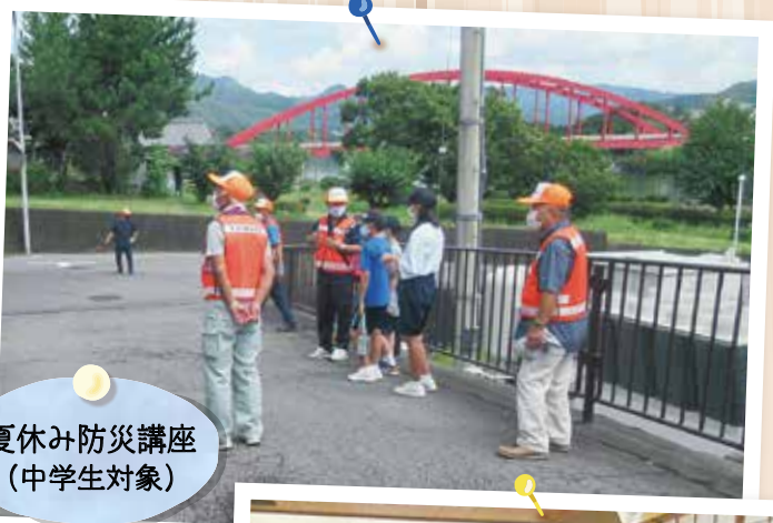
夏休み防災講座 (中学生対象)