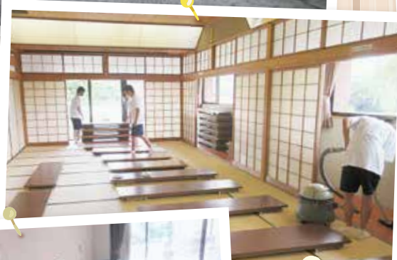
夏休み奉仕活動 (中学生)