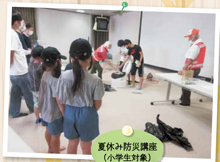
夏休み防災講座 (小学生対象)